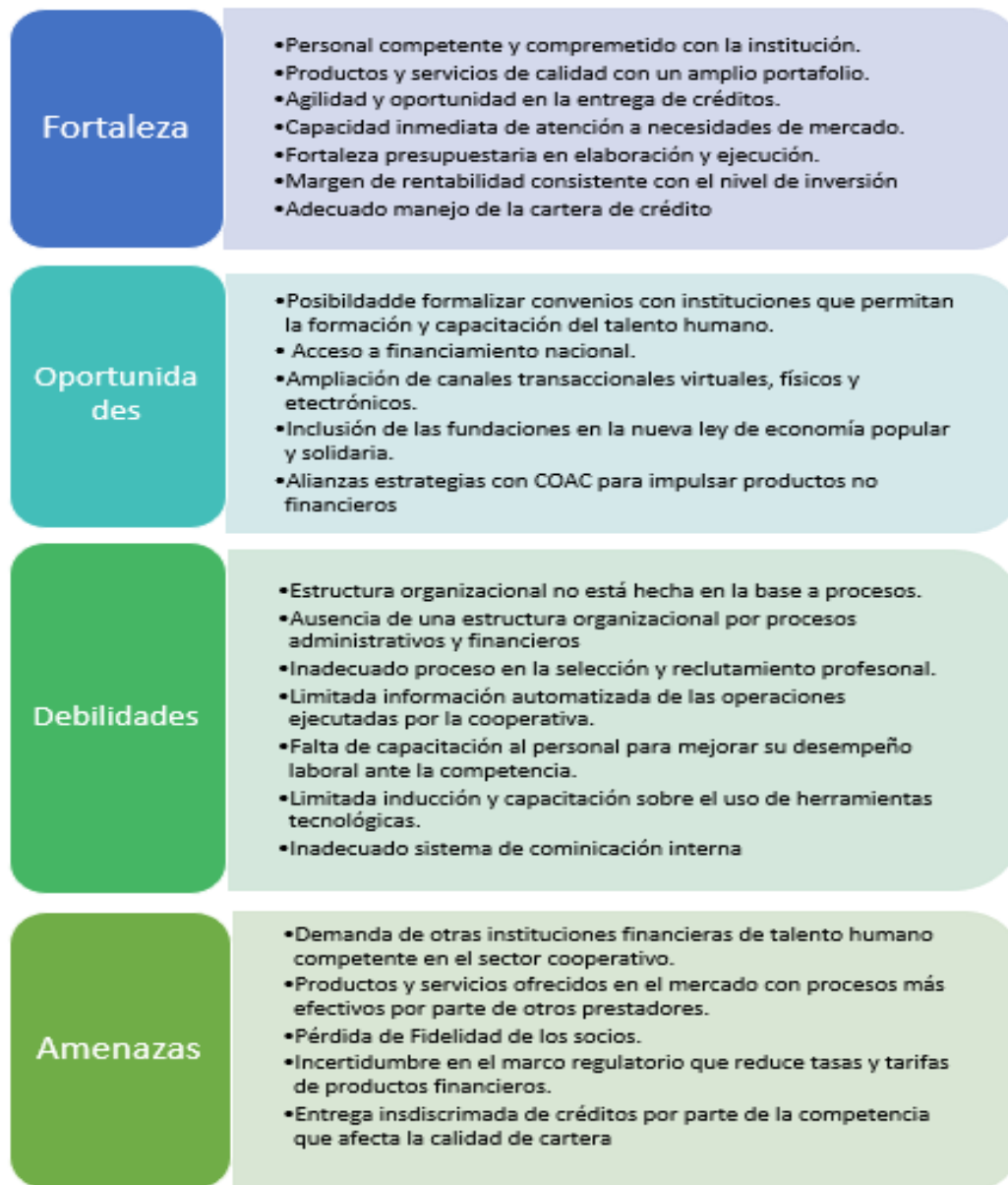
Figura 5: Análisis FODA