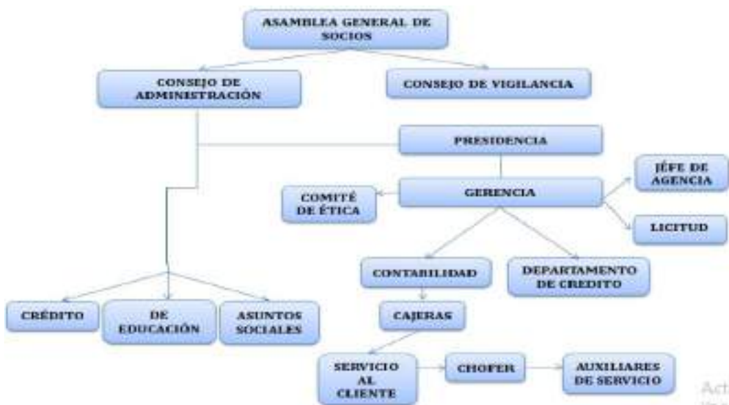
Figura 4: Organigrama Empresarial