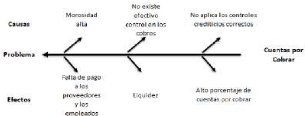
Figura 1: Diagrama de Ishikawa

Elaborado por: Patricia Viviana Rea Puma